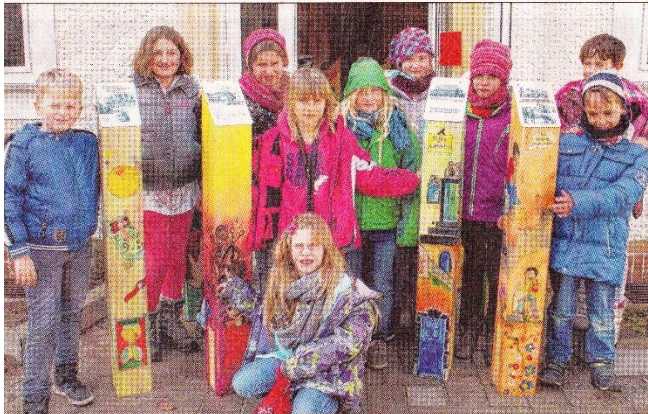
Fotos, Sprüche, bunte Bilder: Kinder der 3. und 4. Klasse zeigen einen Teil der Stelen, die demnächst in Heinersdorf am Anger aufgebaut werden.

Heinersdorfer Hortkinder haben 29 wuchtige Holzstelen gestaltet, die rund um den Dorfanger aufgestellt werden