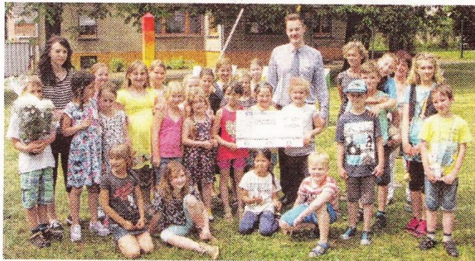
Alle Akteure des Kunstprojekts nach der Scheck-Übergabe der Volksbank-Müncheberg.